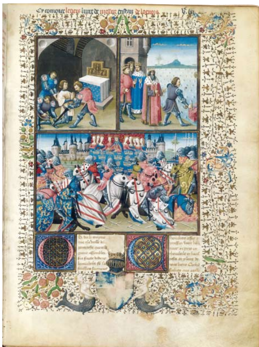
Adoubement de Galaad ; Galaad retirant l'épée du perron ; Tournoi de Camelot ; les armes en bas sont celles de Jacques d'Armagnac, extrait du Tristan de Léonois enluminé par Evrard d'Espinques, 1463 - Paris, BnF, Ms. 99 f° 561.