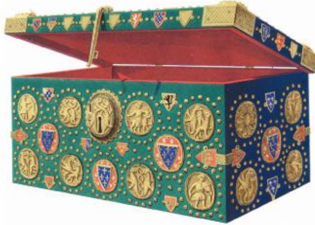
Cassette ou coffret dit de saint Louis au Musée du Louvre : une vue en chromolithographie de cet objet, d'après Edmond Ganneron, La cassette de saint Louis roi de France, Paris, 1855, pl. I. Donnée par Philippe IV le Bel à l'abbaye Notre-Dame du Lis (Dammarie-les-Lys, Seine-et-Marne), elle contenait quatre ossements du roi et son cilice ; elle fut retrouvée en 1853 et Napoléon III la fit déposer au Musée des souverains. Les nombreux écus royaux et de grands féodaux, donnent la date : été 1236.

l'Antiquité, les boucliers d'Achille dans l' Illiade (XVIII, 480-606) et d'Énée dans l' Énéide (VIII, 625-731) étaient fort complexes, le premier montrant le ciel et la terre, et le second annonçant le glorieux destin de Rome.