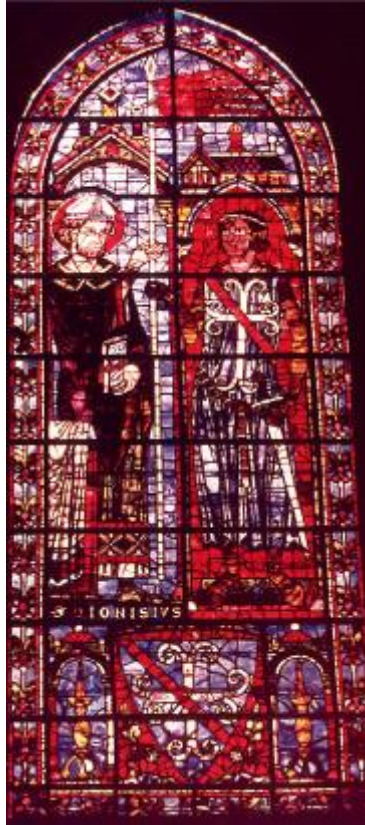
Jean Clément, seigneur du Mez (+1261), maréchal de France en 1223, reçoit l'oriflamme des mains de saint Denis. Ce vitrail datant de vers 1230, montre que la composition héraldique s'est inscrite sur la tunique de ce chevalier, dont la famille donna cinq maréchaux (Notre-Dame de Chartres, transept sud ; tous droits réservés).

Par ailleurs, nous pensons trop souvent au texte qui est l' « esprit » de la devise, alors que son « corps » est fait d'un ou plusieurs objets. Cet ensemble forme ce que l'on appelle le badge de l'autre côté de la Manche où il est très utilisé, même à la place des armoiries. Des familles françaises ont gardé ce genre de souvenir, ce qui se voit par exemple dans les armoiries du duc de Rohan, si l'on en croit l'Armorial de la Chambre des pairs qui date de Louis XVIII (pl. 19): c'est une devise au sens plénier du terme et placée sous l'écu. De Louis XIV à Charles X, la dernière devise personnelle du roi fut le soleil d'Apollon (le corps) avec les mots équivoques Nec pluribus impar (c'est l'esprit), qui inquiétèrent l'Europe. Mais d'autres devises, tout au moins en texte, en esprit, étaient fort orgueilleuses, comme celle des Rochechouart qui évoque toujours leur grande ancienneté. . Les devises, peuvent être très utiles pour identifier les armoiries.