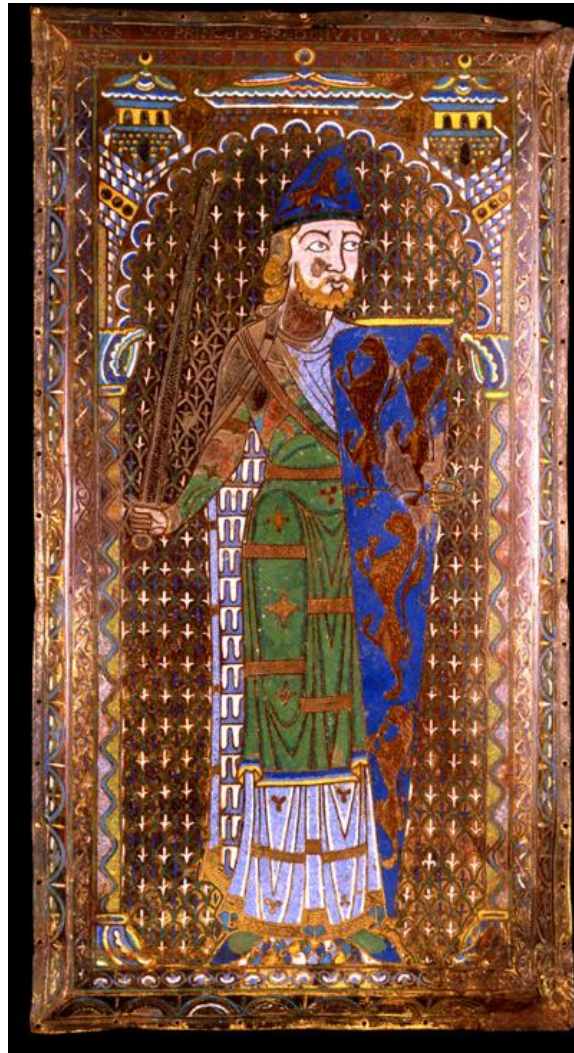
Plaque émaillée pour la tombe de Geoffroi V Plantagenêt, comte d'Anjou (+1151). Ce sont les premières armes formellement établies et authentiques, reçues du roi Henri 1er d'Angleterre, quand celui-ci le fit chevalier en 1128 ; elles seront reprises par certains de ses descendants (Le Mans, Musée de Tessé).

G. Duby nous montre d'ailleurs les changements advenus dans la société dès le XI e siècle, où l'on voit les familles nobles s'approprier un pouvoir autonome, se structurer autour d'une maison forte qui deviendra progressivement château, et dans l'idée de la prééminence de la lignée établie par mâles. C'est au fils que le seigneur transmet le fief, le titre, le surnom familial, les armoiries fixant le souvenir de l'origine agnatique. La lignée devient « maison » et son image qui la fera reconnaître sera les armoiries, image d'une élite qui devient d'ailleurs à cette même époque la fameuse chevalerie.